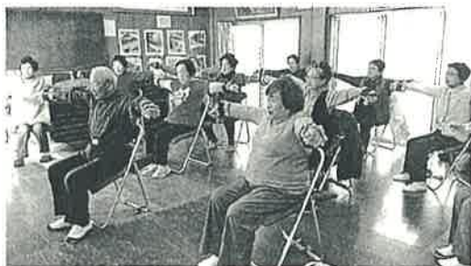
百歳体操で皆さん楽しく元気に!

権大会が群馬県前橋の「正田醬油スタジアム」で開催されました。私はこの大会に90代の選手として砲丸投げと円盤投げの2種目に出場し、結果2種目とも優勝し、表彰されました。この成果は毎週続けてきた「いきいき百歳体操」の結果であると確信しています。今後も無理をせずこの「いきいき百歳体操」を継続していきたいと思っています。